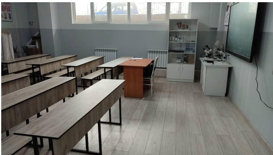
Учебная аудитория 106 “Математика и информатика”